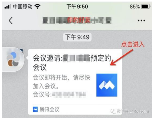
腾讯会议的链接邀请

点击进入腾讯会议的链接邀请，你可以选择小程序入会/电话入会/以及 APP 入会。